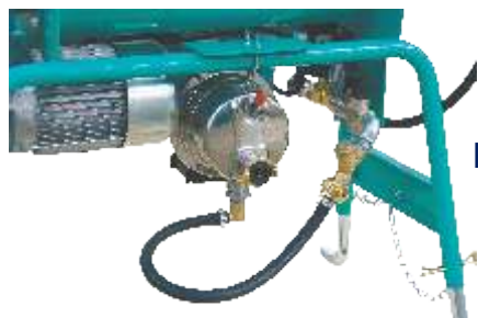
Pompa de apa in echiparea standard

Se foloseste exclusiv pentru materiale cu amestecare rapida